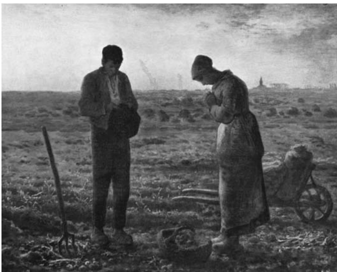
Dette maleriet av Jean-Francois Millet heter kun "Angelus". Bondeekteparet hører kirkeklokkene i det fjerne slå angelusslagene, og bøyer hodet i bønn.