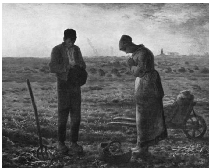
Dette maleriet av Jean-Francois Millet heter kun "Angelus". Bondeekteparet hører kirkeklokkene i det fjerne slå angelusslagene, og bøyer hodet i bønn.