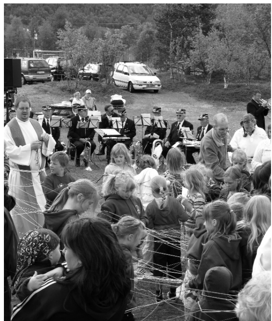
Mange fant veien til sommerSKULK.