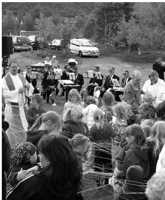
Mange fant veien til sommerSKULK.