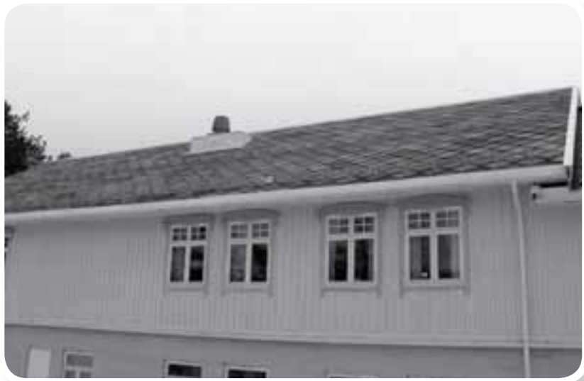
Nylagt tak på Saltdal Menighetssenter