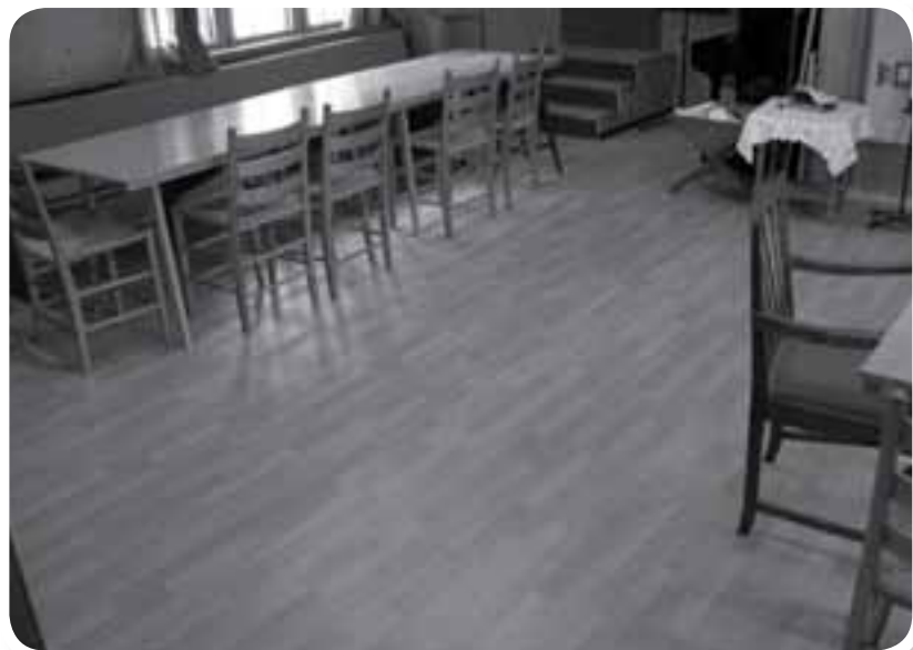
Sakristiet i Øvre Saltdal kirke har fått nytt, fint gulv!

Tusen takk for alle bidrag i 2011 og 2012!