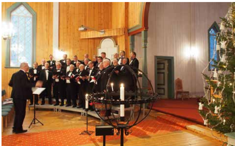
Får vi høre Saltdal mannskor syngje Fra fjord og fjære på gudstjenesten 1. juledag i år?