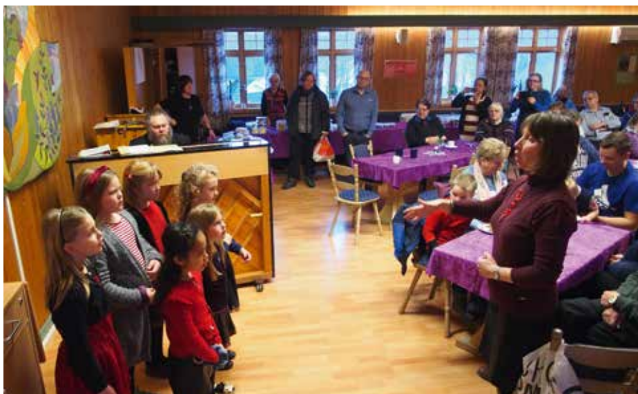
Saltdal kirkes barnekor har vært et kjært innslag på Saltdal menighetscenters julemesse, som i år ikke kan arrangeres på tradisjonelt vis.