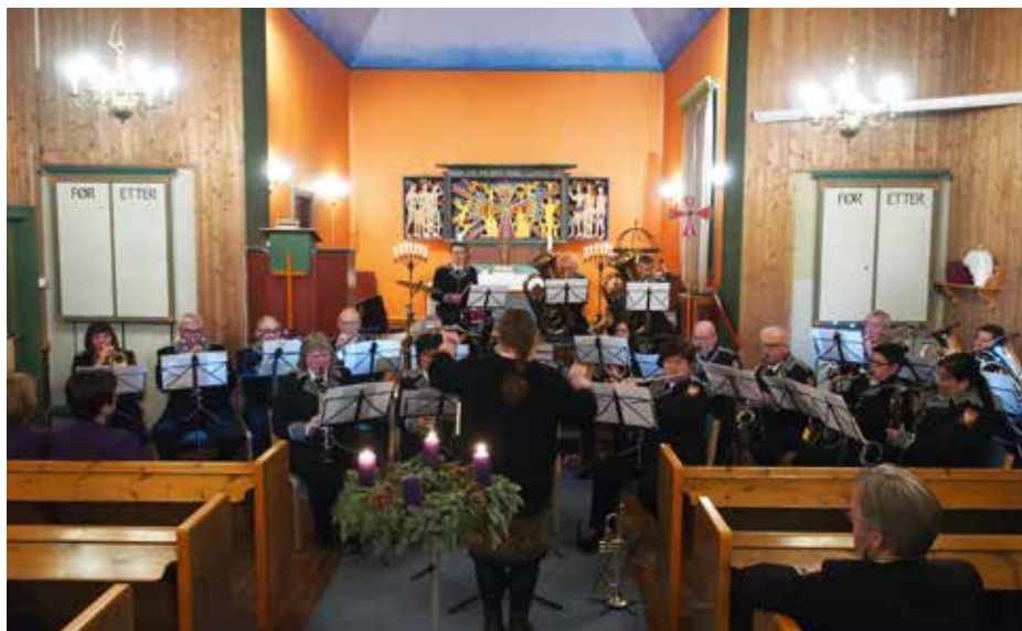
Øvre Saltdal kirke har vanligvis også sine julekonserter: Her er det Rognan hornorkester som spiller i 2019.