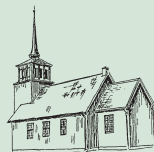
Øvre Saltdal kirke

28.06. kl 17.00 – Gudstjeneste 12.07. kl 11.00 – Gudstjeneste 26.07. kl 18.00 – Gudstjeneste 09.08. kl 11.00 – Gudstjeneste 23.08. kl 11.00 – Gudstjeneste 05.09. kl 11.00 – Konfirmasjonsgudstjeneste 05.09. kl 13.00 – Konfirmasjonsgudstjeneste 27.09. kl 11.00 - Gudstjeneste